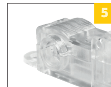
5 надежная конструкция с фиксирующим замком