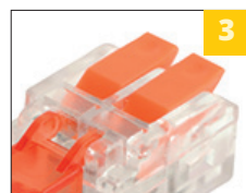
3 пружинная клемма с рычажком