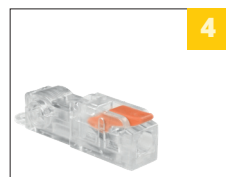
4 варианты ответвления на 1 и 2 провода